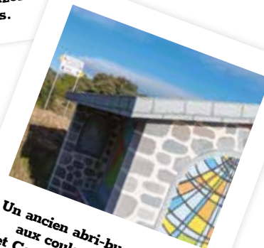
Un ancien abri-bus redécouvert aux couleurs de Rome et Compostelle puisqu'il se trouve au juste milieu du chemin les reliant.