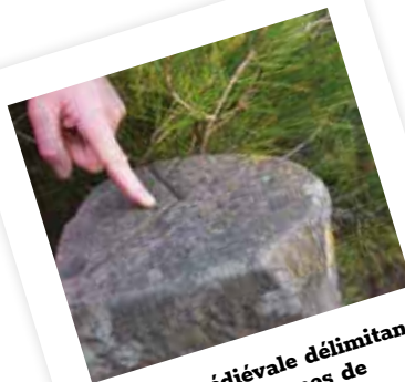
Borne médiévale délimitant les communes de Pouzols-Minervois et de Sainte-Valière.

La promenade se veut dépaysante et riche en contraste. Vous pouvez même la prolonger jusqu'au Mont Ségonne pour profiter d'une vue époustouflante du Minervois.