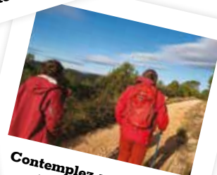
Contemplez un panorama de la Narbonnaise, véritable balcon sur les Pyrénées.