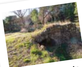
L'un des trois ponts à traverser avant de regagner Pouzols-Minervois.